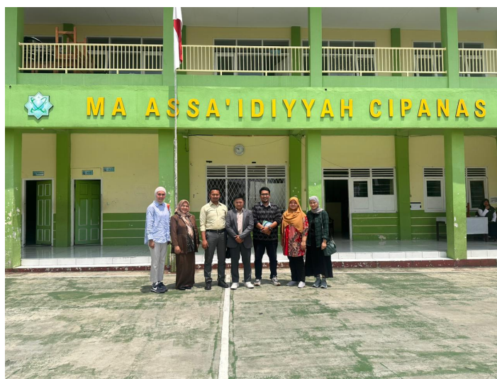
Gambar 2. Kegiatan Pertama Pengabdian Kepada Masyarakat Optimalisasi Penggunaan Teknologi Komunikasi dan Informasi untuk Pengembangan Promosi Madrasah Aliyah ASSA'IDIYYAH

Pertemuan ini membahas mengenai: (1) Pemetaan Permasalahan Mendasar tentang Pemanfaatan Teknologi Komunikasi dan Informasi yang dialami oleh pihak sekolah baik pengajar dan tim promosi sekolah. Peserta pada pertemuan ini berjumlah sekitar 8 orang yang terdiri wakil kepala sekolah, koordinator pengelola media sosial dan promosi dan guru – guru yang memang dianggap paham tentang permasalahan pembelajaran dan promosi yang dihadapi oleh Madrasah Aliyah ASSA'IDIYYAH. Pertemuan ini di mulai dengan pembukaan yang dilakukan Wakil Kepala Sekolah bidang Akademik yang kemudian dilanjutkan dengan diskusi awal mengenai bagaimana sekolah memanfaatkan sosial media dan menggunakan Canva. Pada pertemuan ini, narasumber pertama mencoba untuk menjelaskan mengenai keuntungan dan kelemahan dalam menggunakan Canva dan untuk kegiatan media sosial dan media pembelajaran. Setelah mendapatkan penjelasan mengenai keuntungan dari menggunakan diskusi mulai terarah dan masuk kepada persiapan detail tentang materi apa saja yang dibutuhkan oleh para peserta.