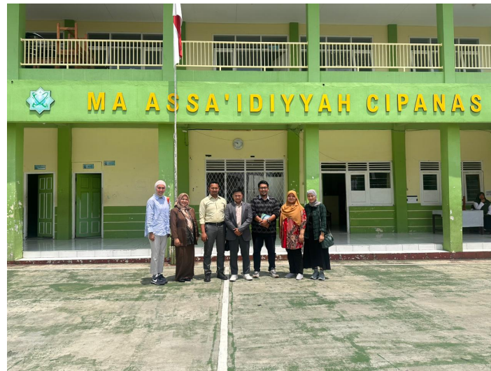
Gambar 2. Kegiatan Pertama Pengabdian Kepada Masyarakat Optimalisasi Penggunaan Teknologi Komunikasi dan Informasi untuk Pengembangan Promosi Madrasah Aliyah ASSA'IDIYYAH

Pertemuan ini membahas mengenai: (1) Pemetaan Permasalahan Mendasar tentang Pemanfaatan Teknologi Komunikasi dan Informasi yang dialami oleh pihak sekolah baik pengajar dan tim promosi sekolah. Peserta pada pertemuan ini berjumlah sekitar 8 orang yang terdiri wakil kepala sekolah, koordinator pengelola media sosial dan promosi dan guru – guru yang memang dianggap paham tentang permasalahan pembelajaran dan promosi yang dihadapi oleh Madrasah Aliyah ASSA'IDIYYAH. Pertemuan ini di mulai dengan pembukaan yang dilakukan Wakil Kepala Sekolah bidang Akademik yang kemudian dilanjutkan dengan diskusi awal mengenai bagaimana sekolah memanfaatkan sosial media dan menggunakan Canva. Pada pertemuan ini, narasumber pertama mencoba untuk menjelaskan mengenai keuntungan dan kelemahan dalam menggunakan Canva dan untuk kegiatan media sosial dan media pembelajaran. Setelah mendapatkan penjelasan mengenai keuntungan dari menggunakan diskusi mulai terarah dan masuk kepada persiapan detail tentang materi apa saja yang dibutuhkan oleh para peserta.