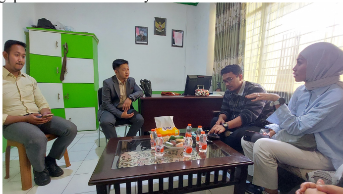
Gambar 3. Diskusi tindak lanjut ke depannya dengan pihak Sekolah

cenderung lebih cocok untuk pengajar muda yang lebih terpapar oleh teknologi. Pada tanggal 27 Desember 2023 sekitar pukul 09.00 – 12.000 WIB, kegiatan pengabdian ini dilanjutkan dengan diskusi dengan wakil kepala sekolah, perwakilan guru, dan ini adalah mendiskusikan mengenai rencana tindak lanjut dan mengidentifikasi strategi promosi Madrasah Aliyah ASSA'IDIYYAH.