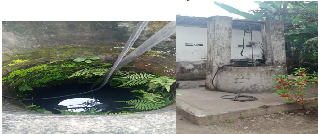
Gambar 2. Kondisi Sumur Timba di Rumah Salah Satu Responden

Hasil observasi yang dilakukan juga mendatangi rumah 5 orang responden, sisanya hanya ditanyai seputar pertanyaan yang penulis ajukan. Dua orang dari lima responden di kediamannya memakai pompa listrik ( sanyo ) dan air sumur timba. Air sumur timba yang terdapat di rumahnya tersebut tidak tertutupi dengan atap sehingga air hujan dapat masuk ke dalam sumur timba tersebut. Keadaan sumur timba yang dibuat untuk membantu penggunaan air dalam kehidupan sehari-hari cukup memperhatikan. Air sumur timba ketika hujan tidak ditutupi, sehingga penggunaan air tersebut tercemar dengan air hujan. Wawancara yang dilakukan kepada enam belas responden memberikan hasil bahwa air ketika musim penghujan sangat melimpah, akan tetapi air hujan tersebut berwarna keruh dan bau.