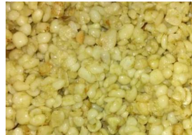
Gambar 2. Tape Hanjeli

Kandungan gizi yang terdapat di biji hanjeli sangatlah beragam salah satunya karbohidrat kompleks, yang berarti memiliki potensi pengganti beras. Selain itu kandungan gizi lainnya yang terdapat di dalam biji hanjeli, seperti prebiotik dan betasitosterol yang bagus untuk mengatasi kadar gula darah dalam tubuh. Dalam biji hanjeli terkandung kalori, protein, karbohidrat, serat, kalsium, zat besi, dan beberapa vitamin, seperti riboflavin (vitamin B2), tiamin (vitamin B1) dan niacin (vitamin B3). Pada 100gram biji hanjeli mempunyai 9,1-23 g protein dan 0,3-8,4g serat. Kandungan protein, lemak, vitamin B1, dan Ca yang kandungan biji hanjeli cukup tinggi (Pasaribu, A. A., dkk. 2022).