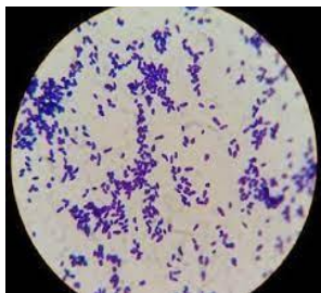
Gambar 3. Bakteri Staphylococcus aureus , Pembesaran 1000x

paru-paru, dan meningitis (Dewi, C. I. D. Y., dkk., 2021).