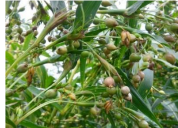
Gambar 1. Tanaman Hanjeli ( Coix lacryma-Jobi )

Kelebihan tanaman hanjeli dari serealia lainnya yaitu dapat mentoleransi kondisi kekurangan air (Fauzi, A., dkk., 2020), lebih tahan hama dan responsif dalam pembuahan (Histifarina, dkk., 2019). Tape hanjeli berbahan dasar biji hanjeli ( Coix lacryma-Jobi ) yang produksinya sangat melimpah di Indonesia, namun pemanfaatannya kurang maksimal (Irwanto, dkk., 2017). Kandungan gizi yang banyak dan kemudahan dalam kultivasi membuat biji hanjeli sangat cocok untuk menjadi sumber bahan pokok pembuatan tape. Hanjeli memiliki tekstur yang kenyal namun tidak lengket sehingga dapat menjadi pangan alternatif sebagai salah satu usaha diversifikasi pangan karena memiliki sumber karbohidrat yang cukup tinggi, dimana dalam 100 gram hanjeli terkandung karbohidrat sebesar 76,4%, protein 14,1%, lemak 7,9%, vitamin B1 0,48 mg, kalsium 54 mg dan serat 0,9% (Nurmala, 2010).