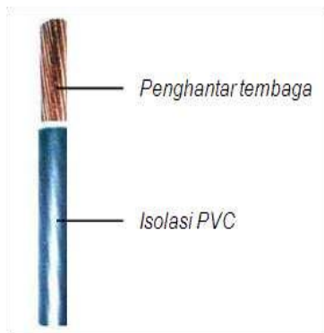
Gambar 1. Konstruksi kabel NYA