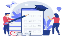
Gambar 3 Contoh Pertanyaan

Setelah pemelajar memahami materi bacaan dan dapat menjawab pertanyaan-pertanyaan yang diberikan, pemelajar mengirimkan jawaban dalam bentuk video dengan menggunakan aplikasi media sosial dan pengajar diberikan akses melihatnya.