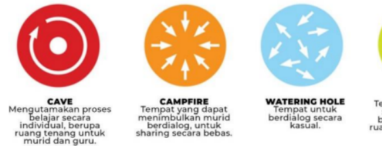
Gambar 1 ruang belajar

pemelajar dapat belajar dengan gaya mereka sendiri.