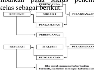
Gambar 1. Siklus Penelitian Tindakan Kelas

Adapun prosedur dalam penelitian ini digambarkan pada siklus penelitian tindakan kelas sebagai berikut.