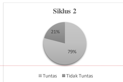
Gambar 3. Persentase Ketuntasan Hasil Belajar Peserta Didik Siklus II

Dengan demikian Berdasarkan hasil tersebut, perlu dilakukan tindak lanjut pembelajaran siklus II dengan menggunakan pendekatan Culturally Responsive Teaching (CRT).